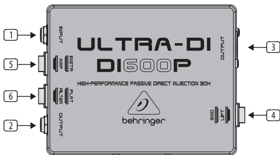
Рис. 1: Вид сверху